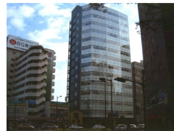
花京院ビルディング