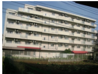
NEXUS COURT 練馬