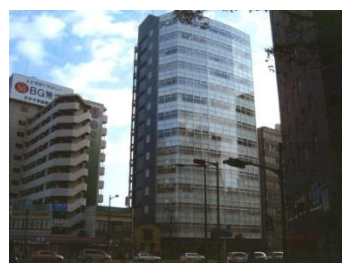
花京院ビルディング