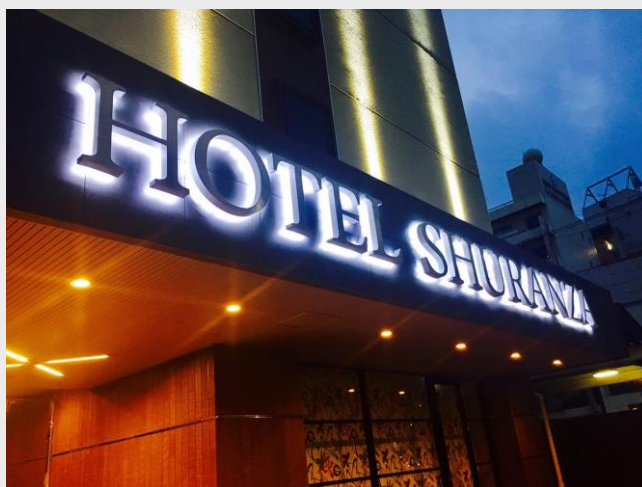
ホテルシュランザCHIBA