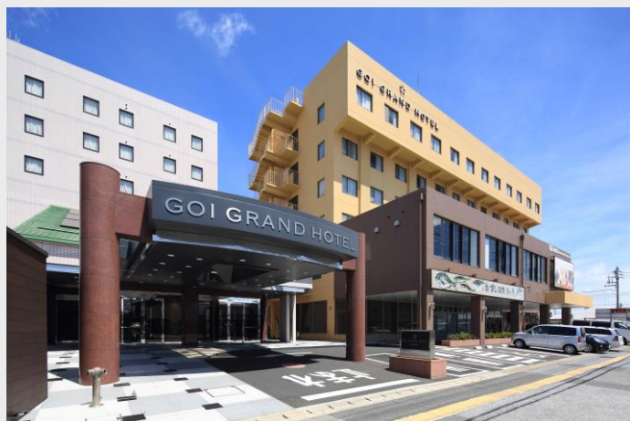
五井グランドホテル